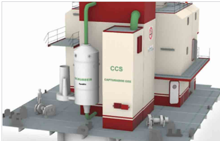
Evolución en las emisiones globales de CO 2 por origen.

El mercado naval, se enfrenta al aumento de la eficiencia energética en buques y la reducción de emisiones para afrontar las nuevas exigencias de Organización Marítima Internacional (OMI) y la Unión Europea (UE) en control de emisiones de óxidos nitrosos (NOx), óxidos sulfurosos (Sox), partículas en suspensión (PM).